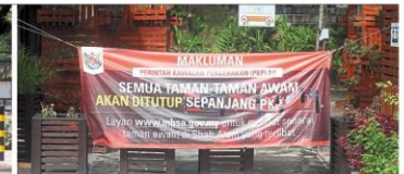
There are banners and tapes around Taman Tasik Shah Alam to keep visitors out.