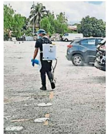
太子园早市巴刹于复业前进行消毒工作。

他说,相信明天太子园早市巴刹重新开后,无法遵照新SOP的顾客会吵闹,理由包括他们没有手机、疫苗电子证书在晚辈那儿、只有一张接种疫苗卡等。