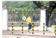
Shah Alam residents head to find open spaces in neighbourhoods to exercise as public parks such as Taman Tasik Shah Alam are closed under NIP's Phase One.