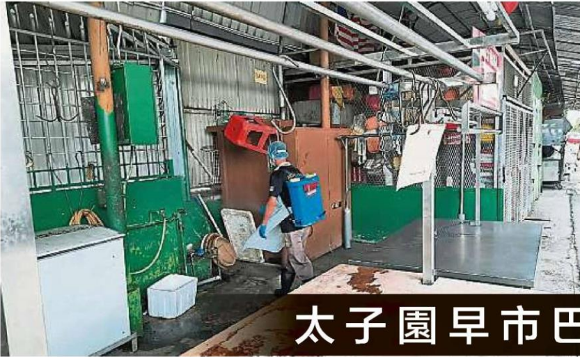
消毒人员在小贩的摆卖摊档进行消毒。